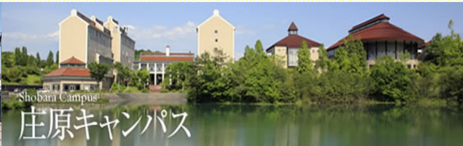
Campus de Shobara