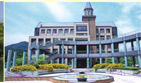
Campus de Mihara