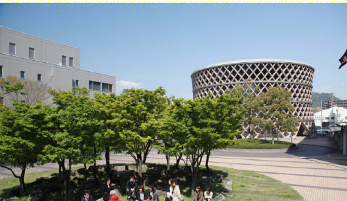
Campus central (Hiroshima)

Para más detalles, consulte la versión en inglés de la página web.